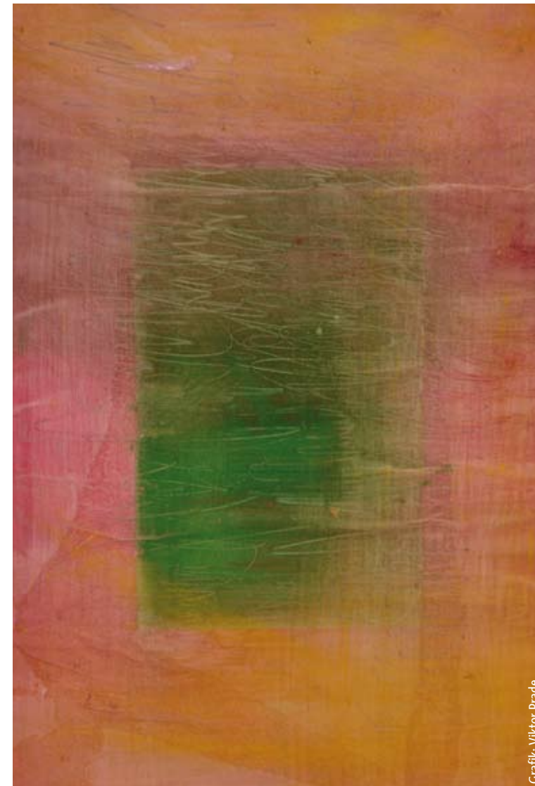
Grafik: Viktor Prade

International Chamber Choir Competition Internationaler Kammerchor-Wettbewerb Arnauer Str. 14 D-87616 Marktoberdorf Germany